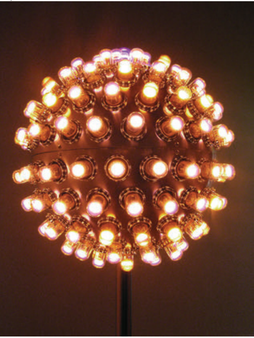
Otto Piene, "Electric Rose", 1965, 160 neon lambalı cilalı alüminyum küre.