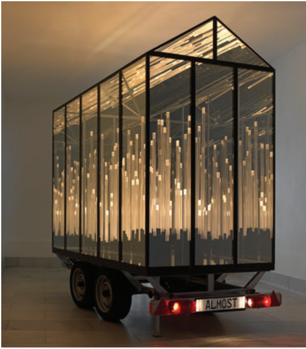
Hans Kotter, "Home, sweet home ... Almost", enstalasyon, metal, pleksiglas, LED ışıklar ve römork, 250x150x200 cm, Osthaus Müzesi, Hagen, 2013.