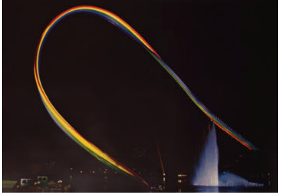
Otto Piene, "Gökkuşağı", 1972 Münih Olimpiyatları için gerçekleştirilen ışık heykeli.

incelikten yoksun bakış açısının yarattığı "ekonomik mucize"ye de odaklanmıştır. Piene'nin yayımladığı ZERO dergisi uluslararası sanat pazarındaki bu yeni estetik anlayış için bir platformdu. 1966'da sanatçı Avrupa ve Amerika'da gerçekleştirilen 55 sergiden sonra grubun "başarılı" sonunu duyurdu. Buna rağmen Otto Piene'ni ışık işleri bugün hâlâ çok seviyor; ışık odalarında izleyiciler problemlerini dışarıda bırakarak dolaşiyor ve yıldız motifleriyle dolu şiirsel bir küreden yansıyan güven verici spotların altında dans ediyorlar. Sanatçı hem sanatın hem de toplumun sınırlarından ve kısıtlamalarından özgürlüğü hedefliyor.